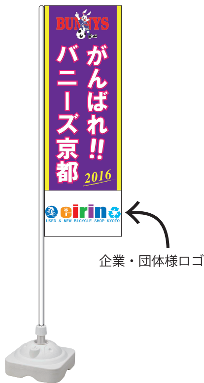
企業・団体様ロゴ

企業・団体様のロゴマークが、 広告枠に入ったオリジナル 応援のぼりを作成いたします。